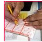
Sardegna, si vincono posti di lavoro

NEWS MODA BELLEZZA POP F&SHOW SHOPPING BENESSERE HOW TO LIFESTYLE